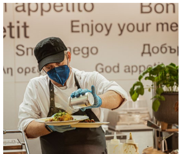
Abbildung 2: DoN Messe Catering