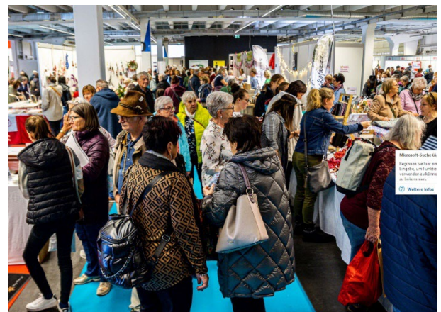
Abbildung 4: Foto im Messebetrieb Kreativmesse 2022