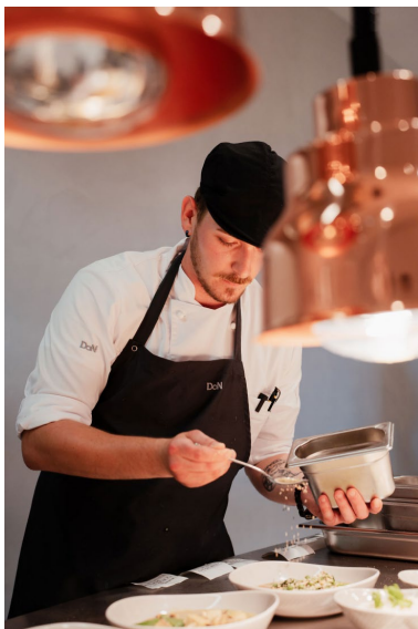
Abbildung 1: DoN Kulinarik